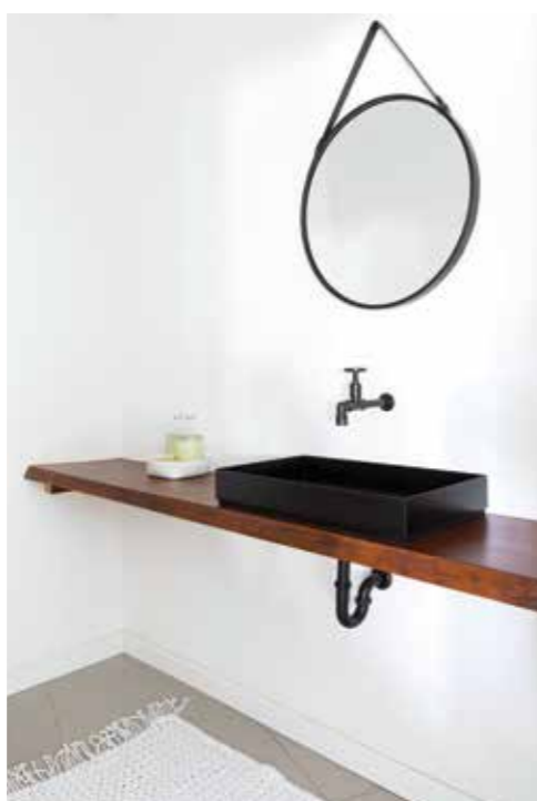
כיוור הרחצה בשירותי האורחים, שמתחבא מאחורי דלת מכיוון הסלון.

”אמבטיית הילדים מרוצפת ומחופה בחומרים שיוצרים בה רקע עיצובי שקט שמדגיש את נגרות ארון הכיור: זהו רהיט שעוצב באופן אישי על ידי המעצבת כשמסגרת ברזל שחורה מרחפת וממסגרת חזיתות עץ עם ידיות שחורות דקות. הן משלבות כיוור שמזכיר את חדרי הכביסה של פעם שחזיתו הלבנה מבריקה חשופה ומאזנת את העץ הגס.”