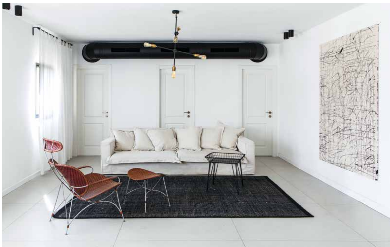
הסלון- תמהיל של שחור ולבן, קליל ומסיבי, משומש וחדש.

החזק של החלל מתקבל בזכות מינון הפריטים שבו: הספה הבהירה המחבקת יושבת מול שולחן הסלון הקליל מברזל שחור. למולם כורסא קלילה שקלועה בסגנון יפני מעודן יושבת על שטיח במראה סקנדינבי. גם הקירות חפים מקישוטים ועבורם נבחרה אומנות אחת של סמדר אליאסף באדיבות גלרייה גורדון, שמשחקת על הגבול שבין המדוייק והקז'ואל. היא חוברת לתעלת המיזוג, ויחד השתיים הופכות את הסלון לייחודי. למרכז הסלון נבחרה תאורה דקורטיבית שיובאה משטוקהולם ומשלימה את הקומפוזיציה, כאשר כמסגרת ניטרלית ורכה לסלון כולו נבחרו וילונות לבנים. ◀