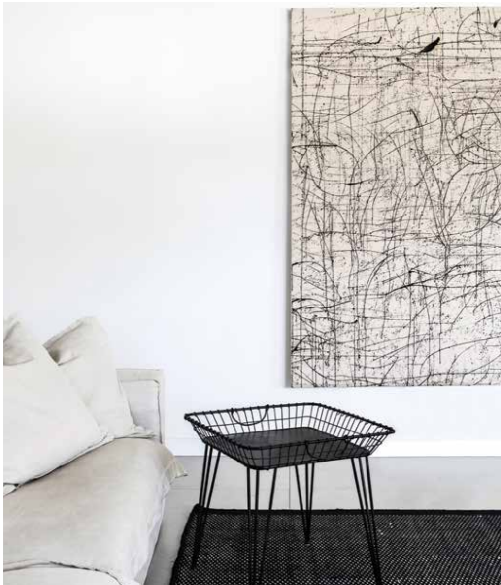
הספה הבהירה מול שולחן הסלון הקליל מברזל שחור.

החזק של החלל מתקבל בזכות מינון הפריטים שבו: הספה הבהירה המחבקת יושבת מול שולחן הסלון הקליל מברזל שחור. למולם כורסא קלילה שקלועה בסגנון יפני מעודן יושבת על שטיח במראה סקנדינבי. גם הקירות חפים מקישוטים ועבורם נבחרה אומנות אחת של סמדר אליאסף באדיבות גלרייה גורדון, שמשחקת על הגבול שבין המדוייק והקז'ואל. היא חוברת לתעלת המיזוג, ויחד השתיים הופכות את הסלון לייחודי. למרכז הסלון נבחרה תאורה דקורטיבית שיובאה משטוקהולם ומשלימה את הקומפוזיציה, כאשר כמסגרת ניטרלית ורכה לסלון כולו נבחרו וילונות לבנים. ◀