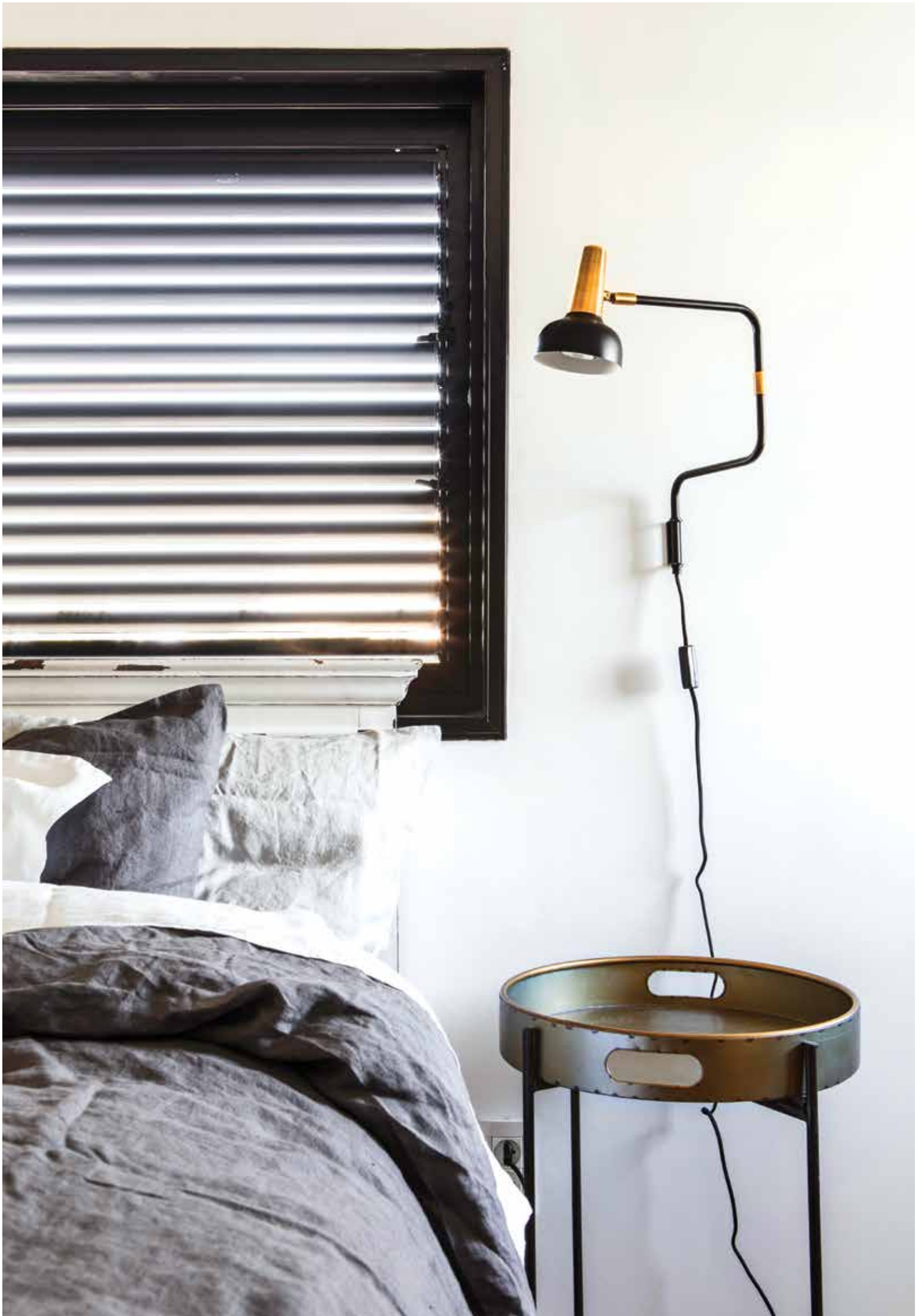
לצד מיטת ההורים גוף תאורה תלוי ושולחן צד, שניהם ממשיכים את הקו העיצובי של הבית.