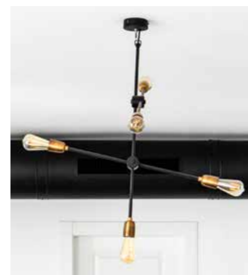
גוף התאורה הדקורטיבי במרכז הסלון.

”הסלון עוצב בקו נקי, מינימליסטי בצבעים. יש בו בעיקר שחור ולבן שמופיעים בהופעות חוזרות ומינוריים שיוצרים הרמוניה שמהדהדת ברקע ולא בונה קונטרסט. מאחורי הספה קיר ובו 3 דלתות שמסתירות שירותי אורחים, מחסן וחדר כביסה ובנוסף תורמות לטשטוש אלכסוני.”