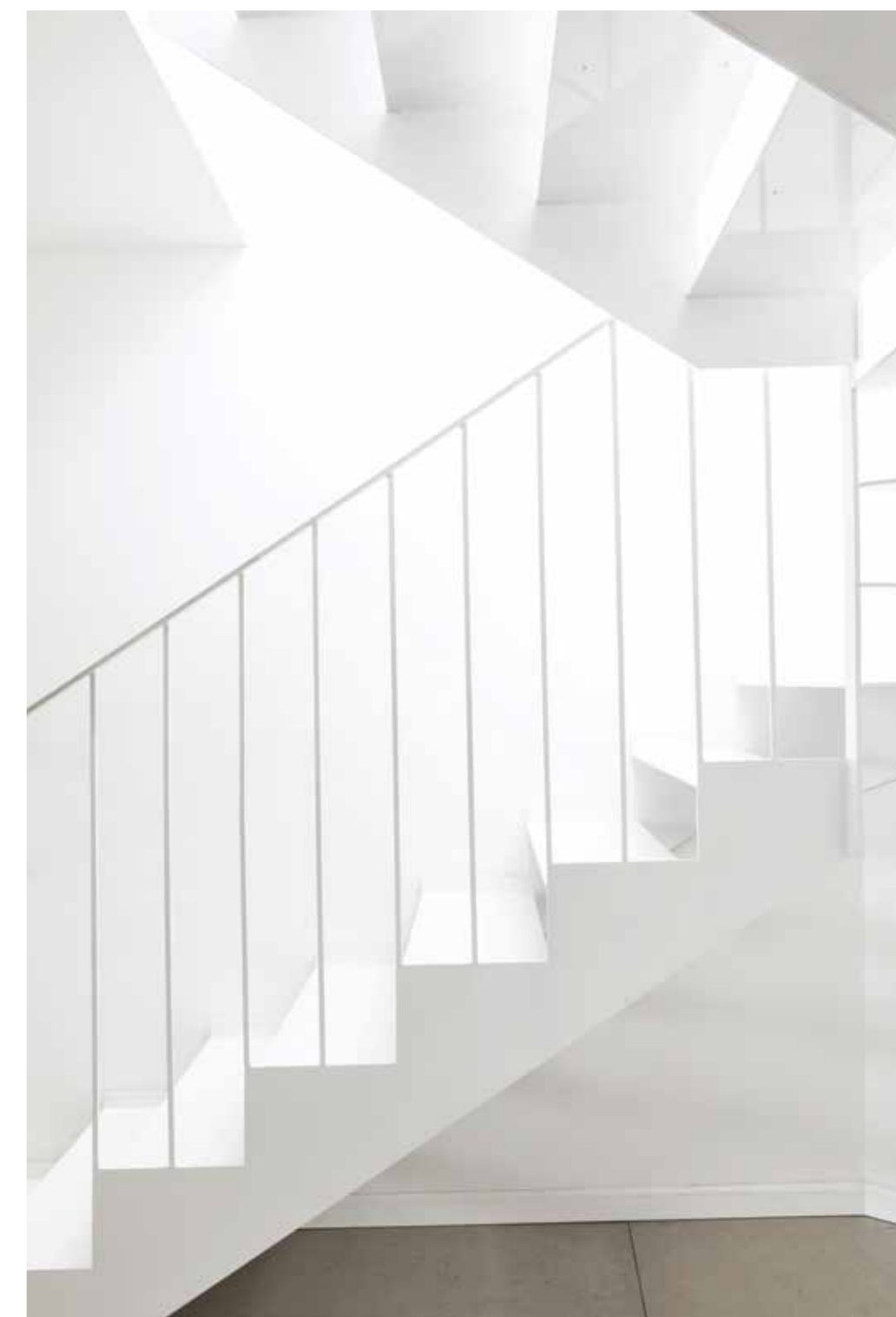
גרם המדרגות המינימליסטי מוביל לגג ועוצב בסגנון הבאוהאוס.