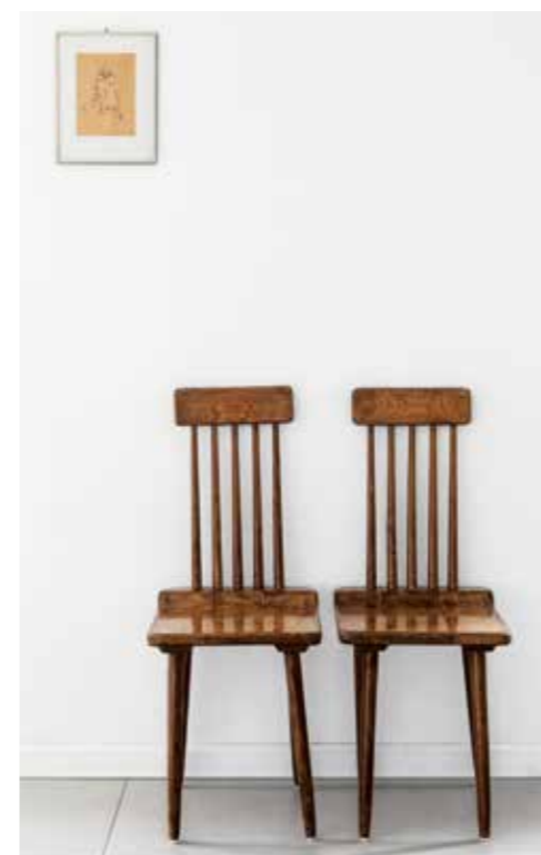
כסאות מעץ בסגנון הבית.