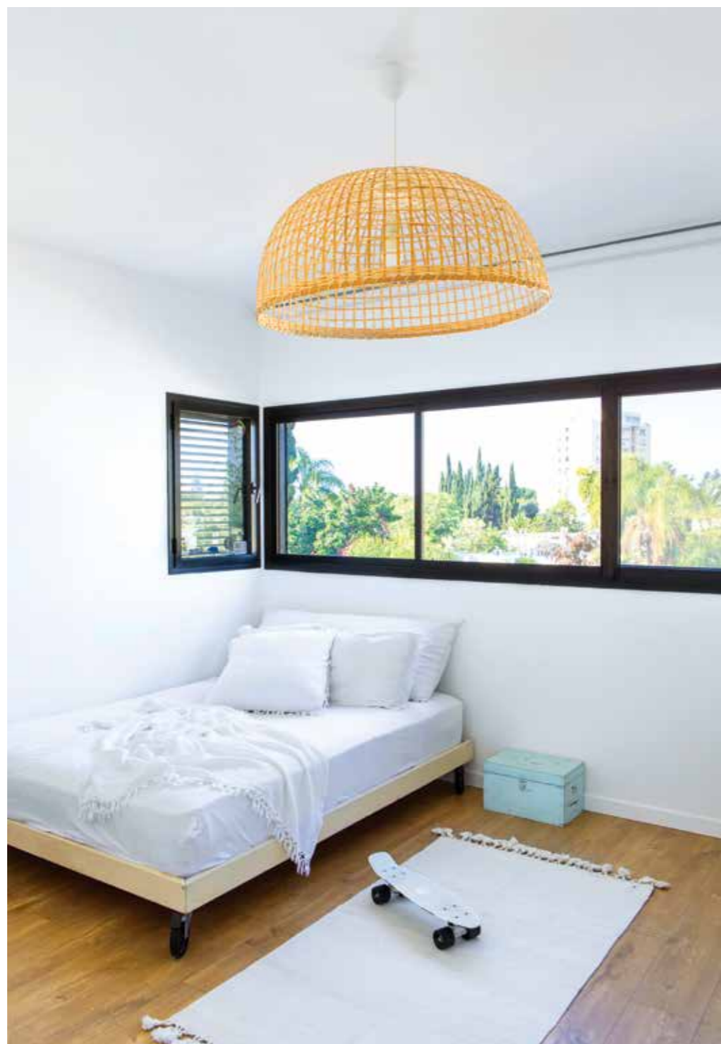
חדר הבת מעוצב באותו מינימליזם ששולט בחלל הציבורי.