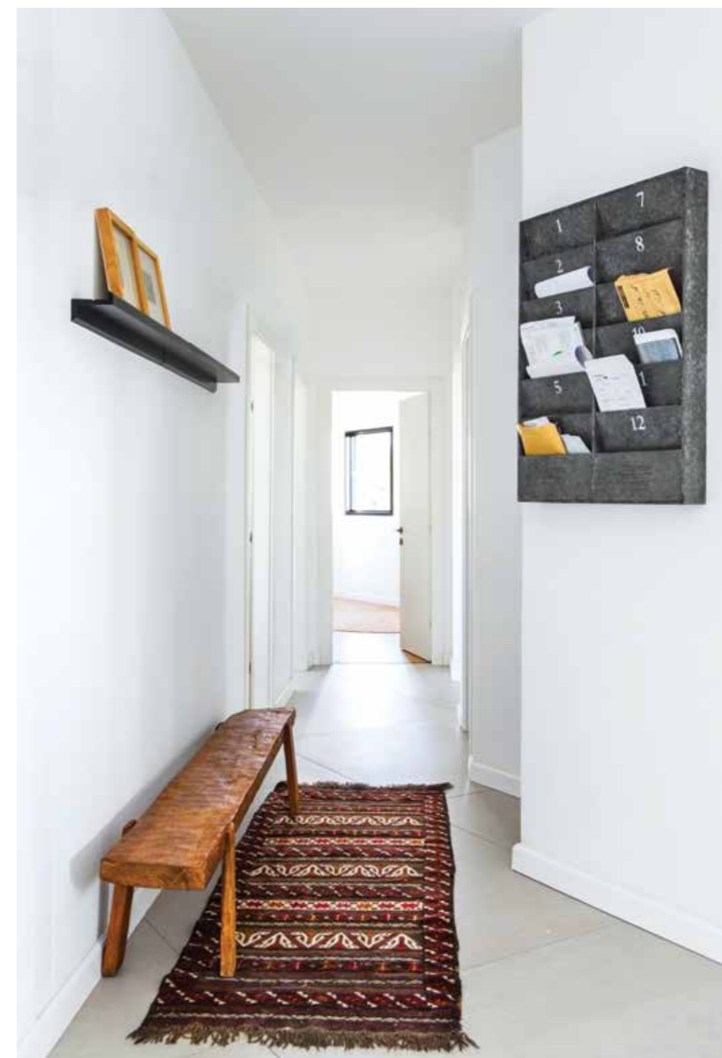
המסדרון המוביל לחדרים- תיבת הדואר יובאה משטוקהולם.

למול הסלון העדין נמצא המטבח הגס, הוא לב הבית לבישול ולאכילה: הוא עוצב בצורת ר' עם קו תעשייתי; מלווה בתאורה שחורה היקפית, כששני גופי תאורה מפליז מהביטאט שטוקהולם נתלו מעל האי שלו. השחור חוזר כאהבה של בעלת הבית גם בחלונות הקלילים וגם בגריל המיזוג, שמקיים דיאלוג עם תעלת הסלון. השחור נמצא גם במשטח העבודה, ומולו משטח האי הלבן, שילוב שיוצר עניין ומינן חומרים נכון. ברז שחור וידיות פליז שמצטרפים לאותו תמהיל, יוצרים איזורים של החומר מהמקרו למיקרו. כחלק מהאיזון, המעצבת ביקשה לחמם את החלל ובחרה בחזיתות עץ לארונות הנמוכים שמתכתבים עם שולחן האוכל שהיה בבעלות המשפחה. הרעיון היה לשים פינת אכילה אחת בבית שתהיה במטבח ולא להכפיל את הפונקציה הזו גם בפינת אוכל חגיגית, מה שמייצר קשר עין עם הילדים ויוצר תחושה משפחתית של ביחד. העץ חוזר גם בעגלת התבלינים, שמכניסה את אותו מראה משומש למול החדש והתעשייתי. ◀