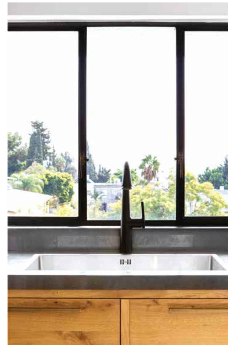
ברז המטבח שחור, כמו גם החלונות שמאחוריו.