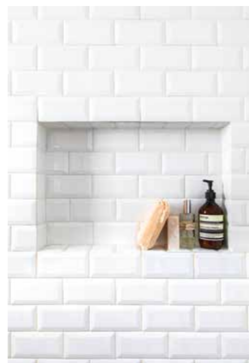
פרט נישה מתוך מקלחון ההורים.

המעבר למרחב הפרטי מתרחש דרך מסדרון אלכסוני. בפתחו נתלתה תיבת דואר מופח, אביזר דקורטיבי שגם הגיע משטוקהולם. למרגלותיה נפרש שטיח שהוא ירושה משפחתית המכניס צבעונית ששוברת את נוף צבעי הבית, ועליו ספסל עץ משומש מהמזרח שהיא עדות לחיים שלמים שעברו עליו. 3 חדרי הילדים נמצאים זה לצד זה והוקדשה להם אמבטיה משותפת. היא מרוצפת ומחופה בחומרים שיוצרים בה רקע עיצובי שקט שמדגיש את נגרות ארון הכיור: זהו רהיט שעוצב באופן אישי על ידי המעצבת כשמסגרת ברזל שחורה מרחפת וממסגרת חזיתות עץ עם ידיות שחורות דקות. הן משלבות כיוור שמזכיר את חדרי הכביסה של פעם שחזיתו הלבנה מבריקה חשופה ומאזנת את העץ הגס. מעליו נתלתה מראה במסגרת שחורה בעבודה אישית ע"י מסגר, שייצר גם סולם מדפים שחור באותו סגנון וצבע. בסוף המסדרון ממוקם חדר