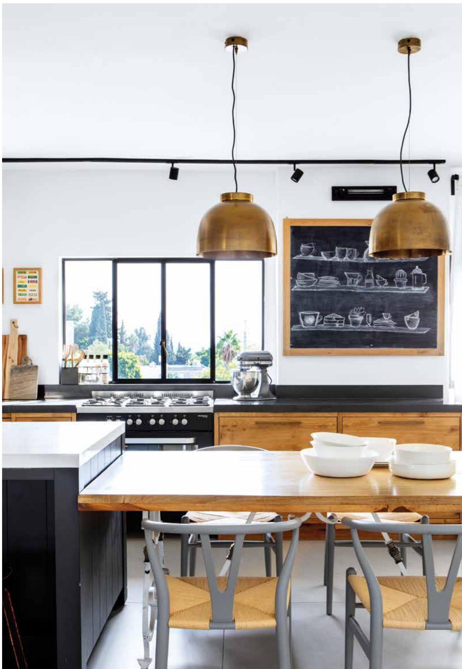
המטבח מלווה בתאורה שחורה היקפית, כששני גופי תאורה מפליז מהביטאט שטוקהולם נתלו מעל האי.