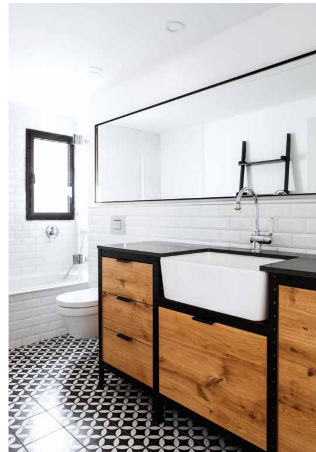
באמבטיית הילדים ארון האמבטיה הוא פריט עיצובי ייחודי שמכתיב את אופי החלל.

”אמבטיית הילדים מרוצפת ומחופה בחומרים שיוצרים בה רקע עיצובי שקט שמדגיש את נגרות ארון הכיור: זהו רהיט שעוצב באופן אישי על ידי המעצבת כשמסגרת ברזל שחורה מרחפת וממסגרת חזיתות עץ עם ידיות שחורות דקות. הן משלבות כיוור שמזכיר את חדרי הכביסה של פעם שחזיתו הלבנה מבריקה חשופה ומאזנת את העץ הגס.”